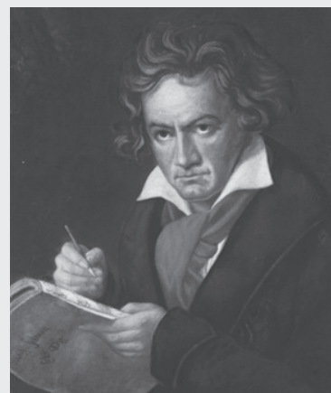
▲ Beethoven retratat per Joseph Karl Stieler (1819).